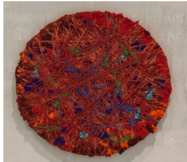
Sheila Hicks , Carnaval in Orbit , 2021-2022