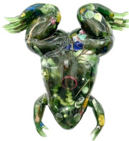
Bryan Crockett, Xenomorph (Loire) , 2024

L'artiste américain Bryan Crockett est fasciné par le fait que les grenouilles n'ont aucune barrière entre leur corps et leur environnement. Les grenouilles respirent par la peau, ce qui les rend très sensibles à la pollution et aux changements environnementaux. En créant ces sculptures de grenouilles surdimensionnées, Crockett souhaite transmettre l'idée que, comme la grenouille, nous sommes également affectés par la contamination des eaux environnantes.