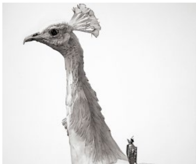
Fabien Merelle, l'oiseau merveilleux , 2023