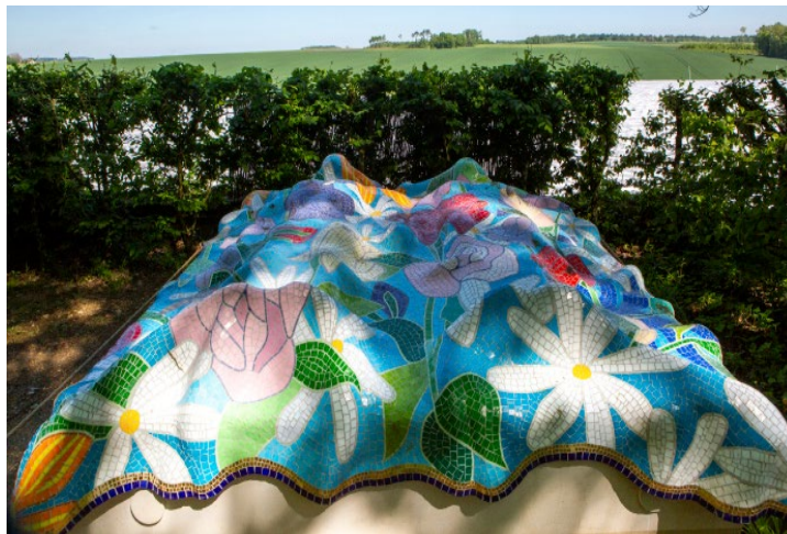
Lionel Estève, La rose est sans pourquoi

Au fil des saisons, les roses seront ainsi toujours présentes dans les jardins du Rivau.