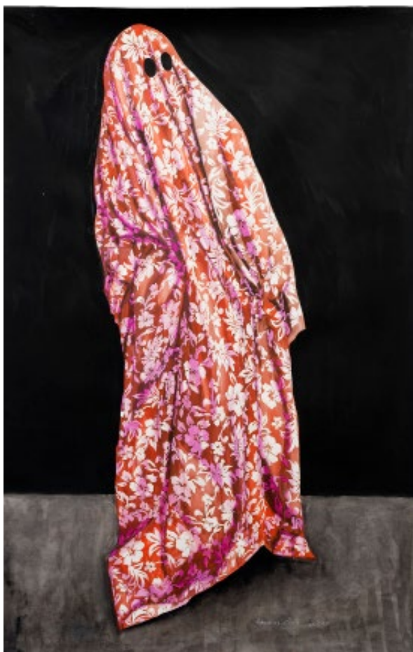
Gilles Barbier, Hawaïen ghost , 2019 Gouache sur papier, 158 cm x 105 cm Collection Château du Rivau