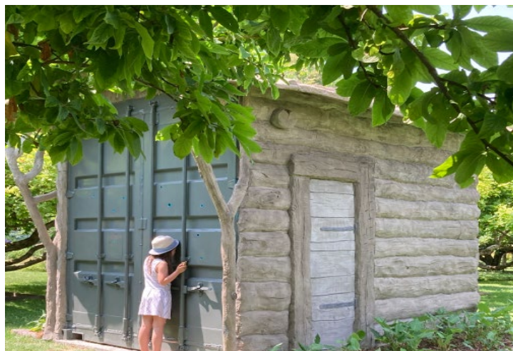
Julien des Monstiers, La Cabane

L'atmosphère onirique qu'inspire une cabane abandonnée au milieu des arbres s'efface lorsqu'on s'approche. L'une des faces semble être un container ! Julien des Monstiers brouille les frontières entre deux imaginaires: le conte de fée et le monde réel et ses contenants transportant des marchandises manufacturées, synonymes de mondialisation, loin des pratiques artisanales d'antan.