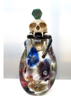
Erik Dietman, l'âme à poil, 1993

Dans un esprit de dialogue entre art du passé et du présent a inspiré à l'artiste Erik Dietman